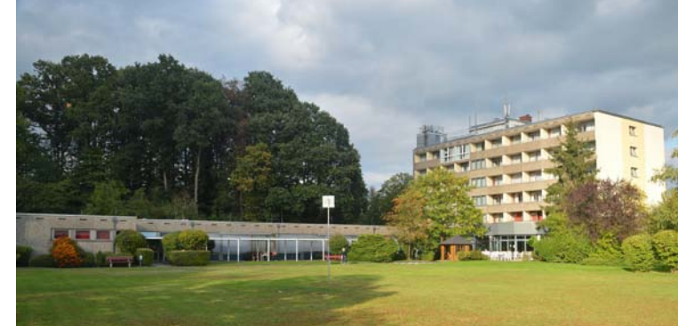
Die Celenus Fachklinik Bensberg